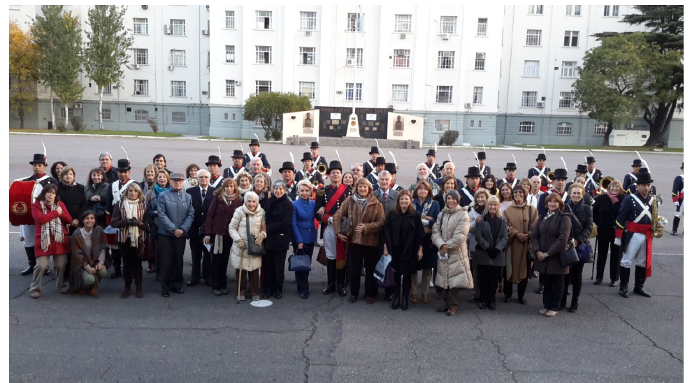
Los alumnos de la Diplomatura con la Banda de Patricios

La Banda se despidió con "El Uno Grande" que es la Marcha del Regimiento.